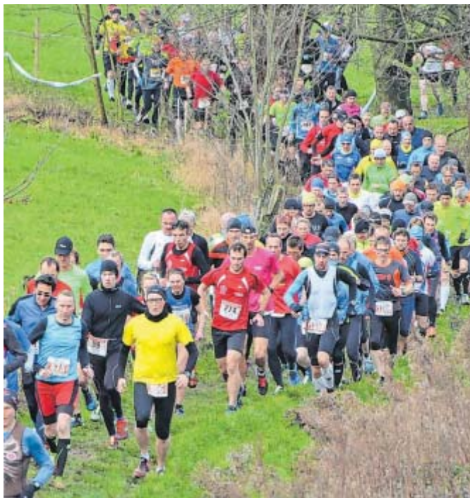
Immer fleißig querfeldein: Für den Weihnachtscrosslauf in Borgholzhausen muss man geländegängig sein.